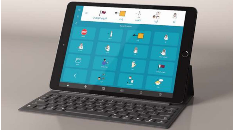
الشكل 2. تطبيق تواصل للتواصل البديل والمعزز (المصدر):